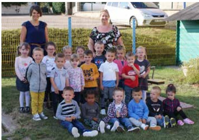
Vahl-Ebersing Petite et Moyenne Section maternelle, 21 élèves Enseignante : Mme Zieger