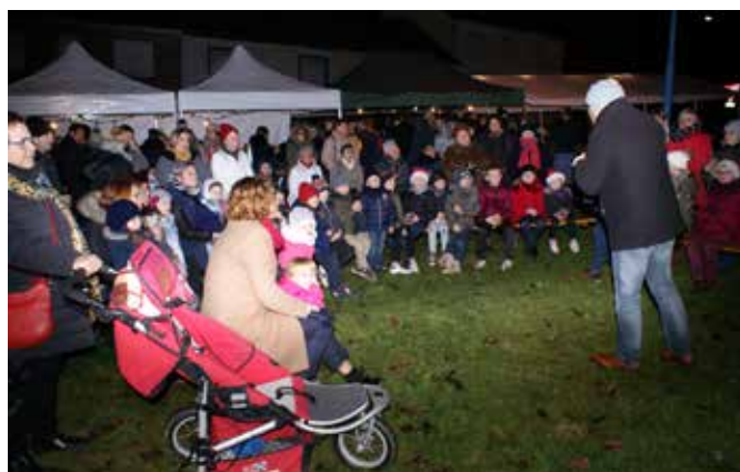
Veillée de Noël