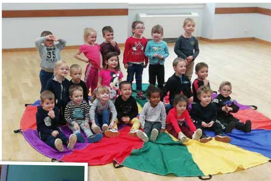
Fête du sport