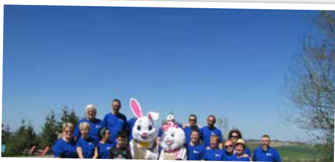
Chasse aux oeufs