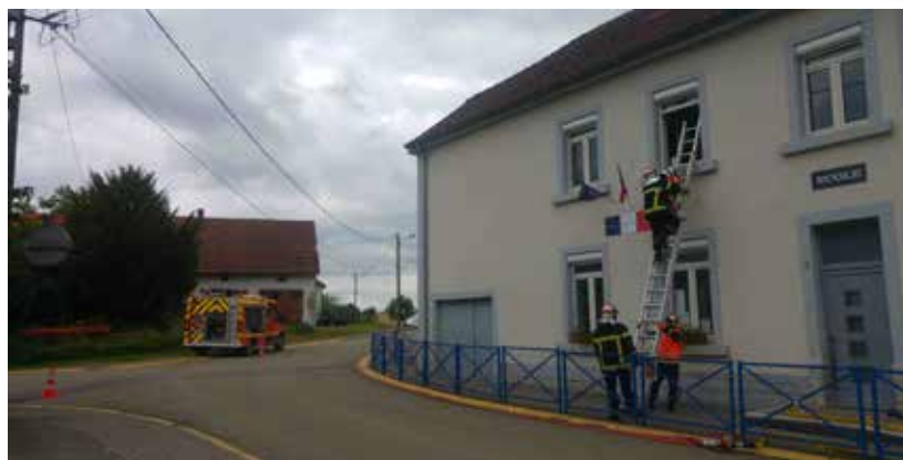
Exercice incendie pompiers