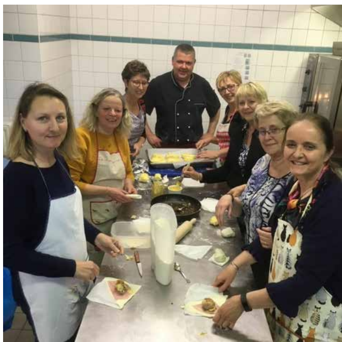
Cours de cuisine