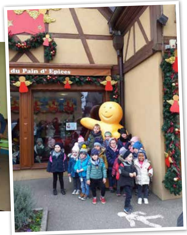
Sortie en Alsace