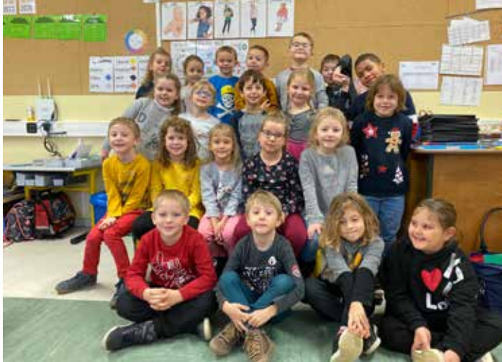
Laning CP Enseignant : Madame.....