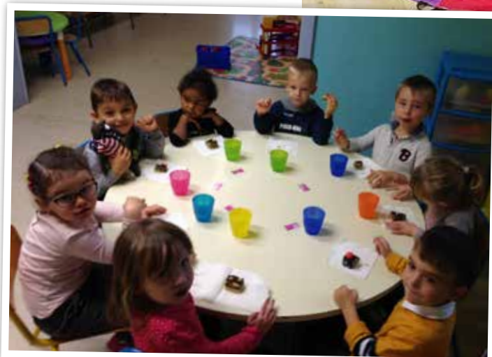
Semaine du goût