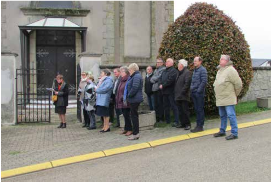
Commémoration du 11 novembre