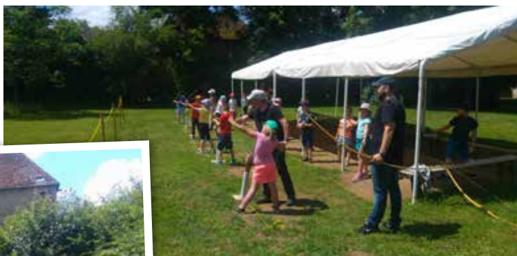
Château de Jaulny