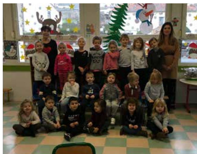
Altrippe Petite et Moyenne Section maternelle Enseignante : Mme Selles