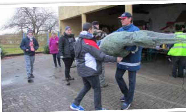
Vente de sapins et de biscuits de Noël