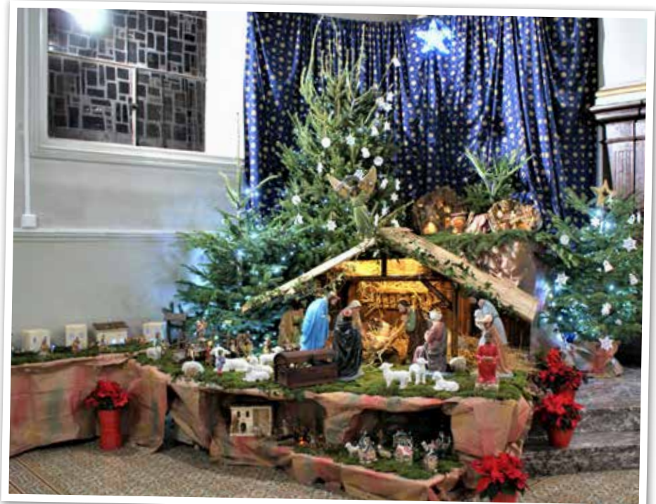
Crèche église Noël 2019