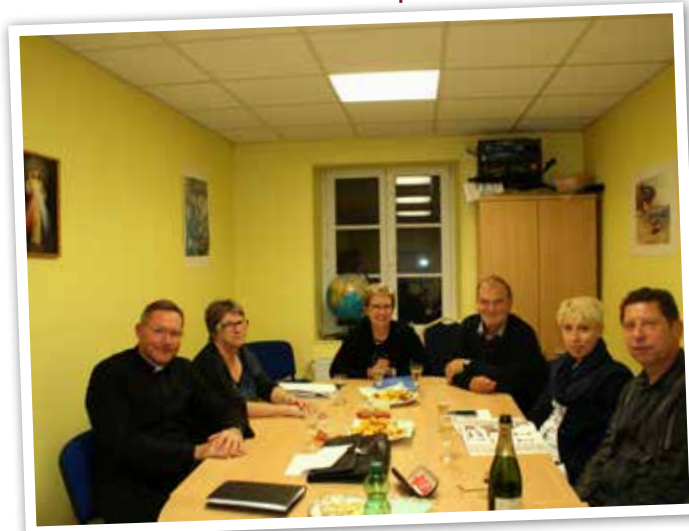
Table de la Parole

Depuis concile Vatican II, on nous fait connaître l'importance de deux tables dans l'église : la première, « la table eucharistique » communément dit « autel », la deuxième, « celle de la parole » l'ambon, lieu de lecture des épîtres et évangile ; elles devraient être à l'identique ; nous envisageons l'achat de cette table de la parole qui ressemblera au maître autel.