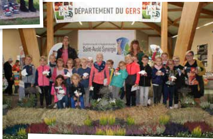
Salon Agri Synergie St-Avold