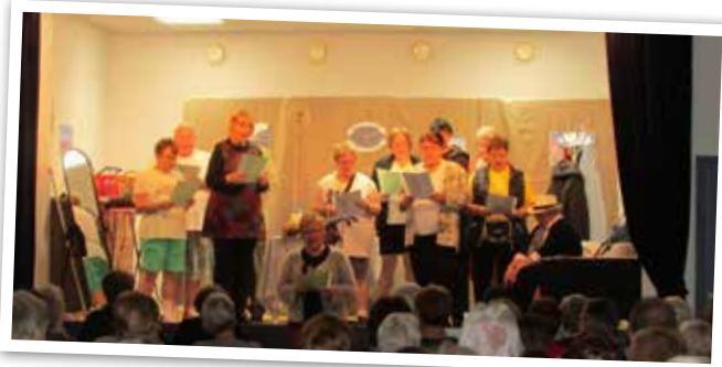
Théâtre en platt