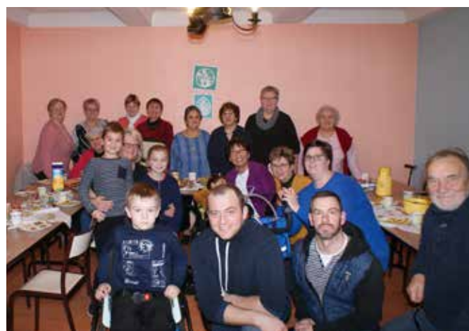
Remise du chèque à association