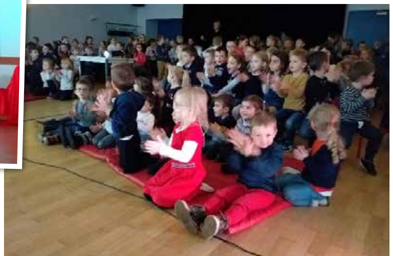
Spectacle de Noël