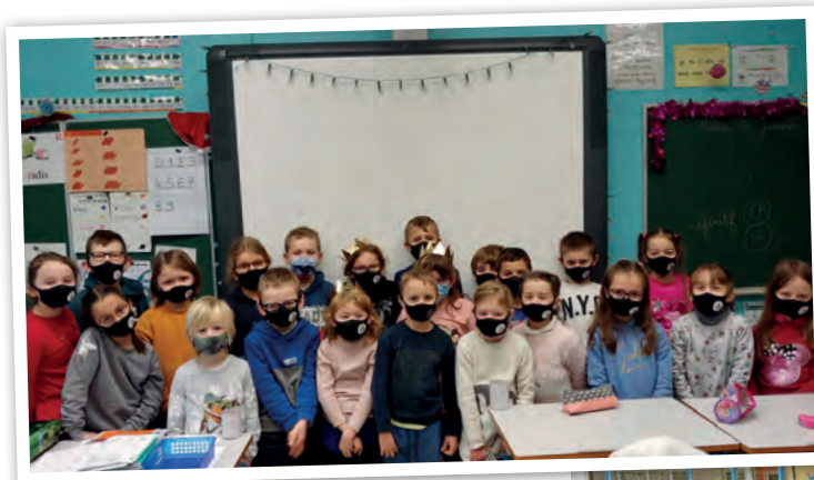
Galette des rois