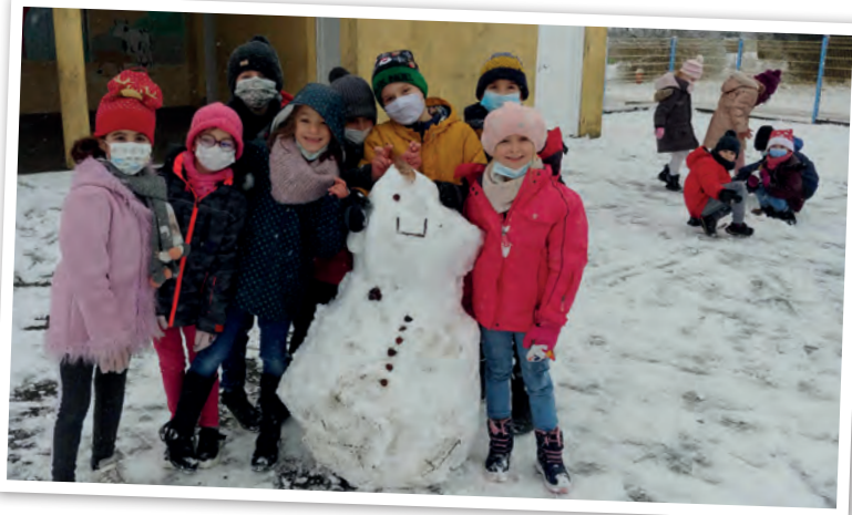
Neige dans la cour, fin 2021