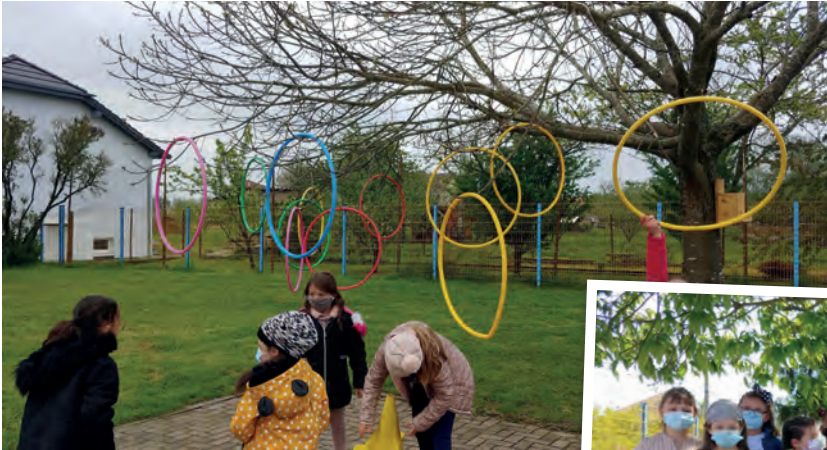
Déco de récréation