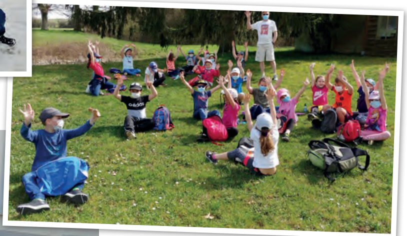
Promenade en nature