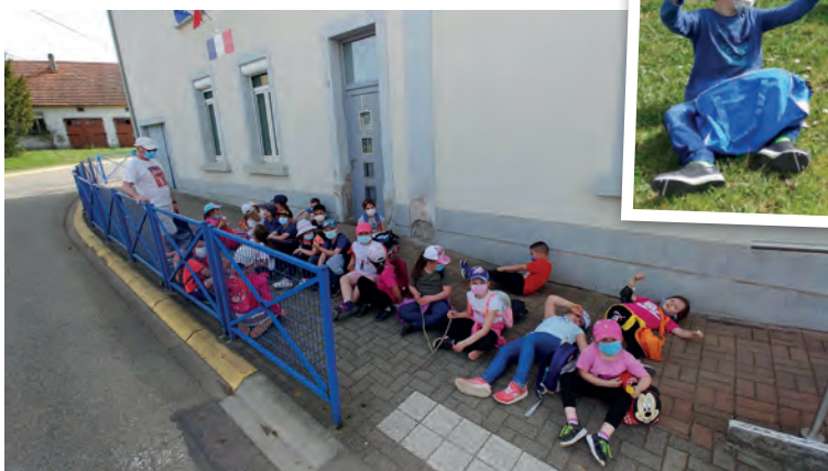
Retour de promenade