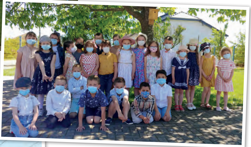
Jour de photo de classe