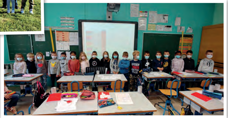
Du plus petit au plus grand