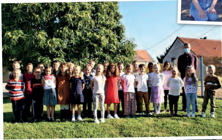
Rentrée de septembre